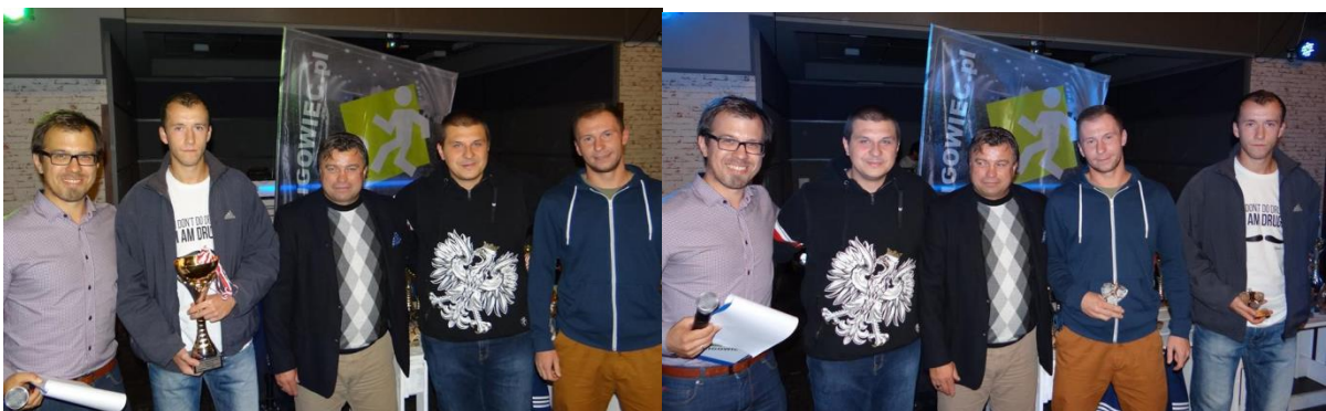
Gracze BRSu ze statuetkami za kolejne zwycięskie sezony. Zdjęcia wykonano na uroczystych „Zakończeniach sezonów” Ligowca (10.01.2015, 10.04.2015, 11.09.2015).